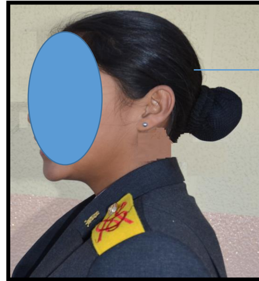
→ Peinado Reglamentario