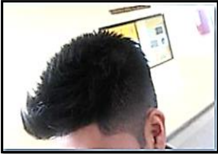
Cabello Largo /Peinado NO Acorde