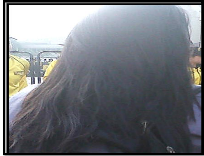
Sin Recoger / Sin Malla